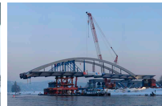
Einschwimmen des Brückensbogens