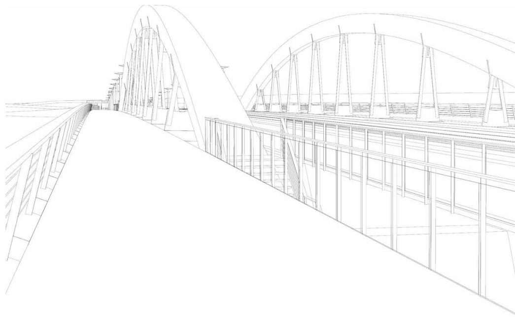
Brückendeck aus Fußgängersicht